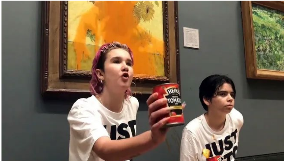
Рисунок 2. Активисты из Just Stop Oil, выступающие за остановку новых нефтегазовых проектов, в Лондонской национальной галерее приклеили свои ладони к стене