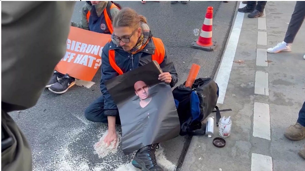
Рисунок 1. Городские власти вызвали полицию для освобождения активистов, которые прикрепили себя к дороге суперклеем.

В 2022 году в немецком городе Майнц, климатический активист использовал смесь песка и суперклея для прикрепления своей руки к проезжей части, из-за чего вызвал не только ажиотаж в медиа, но и стал причиной довольно сложной процедуры со стороны полиции по «разрезанию» перфоратором асфальта (см. рис.1), что, впрочем, не привело к повреждениям: со слов самого участника, он смог сам счистить асфальт с руки без обращения к врачам. Среди комментаторов события в соцсетях обсуждалось, что действия активиста привели к прямо противоположным последствиям тому, на что был ориентирован его перформанс – водителям приходилось менять маршрут (и, очевидно, тратить больше топлива) или оставлять включённым двигатель в попытке выйти из машины и выяснить происходящее (что приводило к относительно большему количеству выхлопов, чем если бы на дороге не было препятствий).