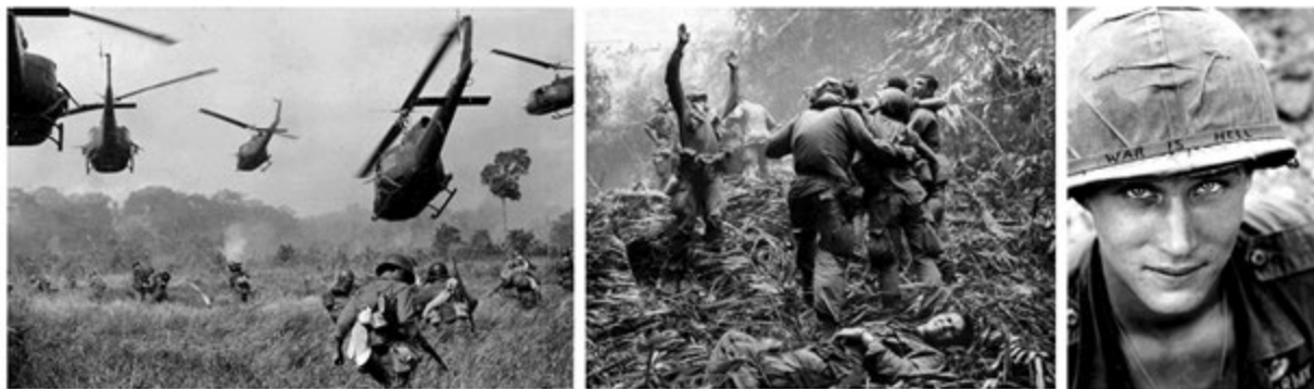
Рис. 1 Фотографии военных действий во Вьетнаме (1955 – 1975)

Как вы считаете, воспроизводимы ли индивидуальные воспоминания? Действительно ли память умирает с каждым человеком, а любая реконструкция памяти сводится к идеологической работе с медиа архивами (текстами, фото, видео, рисунками и т.п.)? Другими словами, общество может выбирать и обсуждать, но не способно помнить? Пожалуйста, предложите программу социологического исследования и раскройте вашу позицию с опорой на теоретическую и эмпирическую аргументацию.